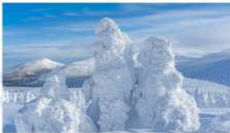
SNOW MONSTERS AT SUMIKAWA SNOW PARK