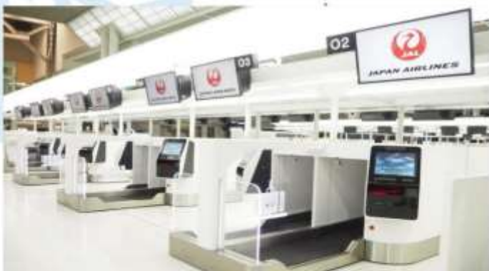
NARITA INTERNATIONAL AIRPORT

"สนามบินนานาชาตินาริตะ" เป็นสถานที่ที่นักท่องเที่ยวส่วนใหญ่จะได้สัมผัสเป็นที่แรกหลังจากมาถึงญี่ปุ่น ที่นี่เป็นสนามบินที่ทันสมัย สะดวกสบาย และได้รับการออกแบบมาเป็นอย่างดี อาคารผู้โดยสารหลักสองแห่งมีทั้งร้านค้า ร้านอาหาร พื้นที่นั่งรอสุดผ่อนคลาย หอชมทิวทัศน์ และกิจกรรมต่างๆ ที่จะช่วยให้คุณเพลิดเพลินอยู่ตลอด