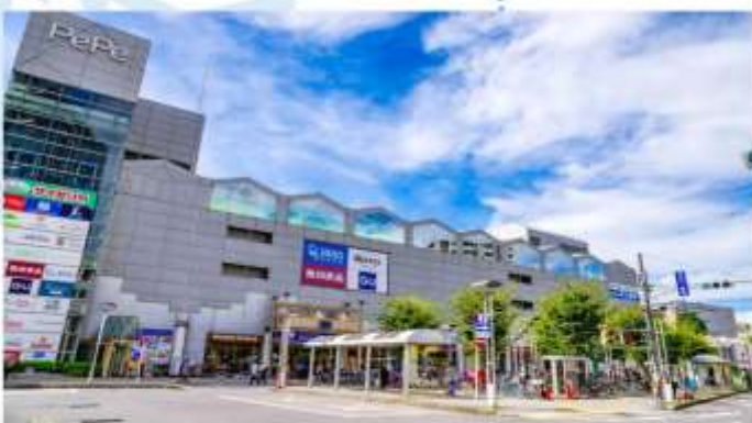
SHOPPING AT SHINJUKU

หมายเหตุ: เพื่อให้ท่านได้ใช้เวลาอย่างเต็มที่ มีคฤศกจะนัดหมายจุดรวมพล และเวลาเดินทางกลับตามที่กำหนด