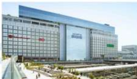
SHOPPING AT SHINJUKU