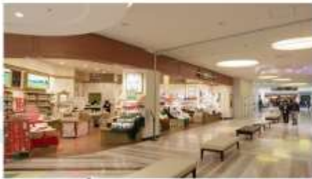
SHOPPING AT AEON MALL NARITA