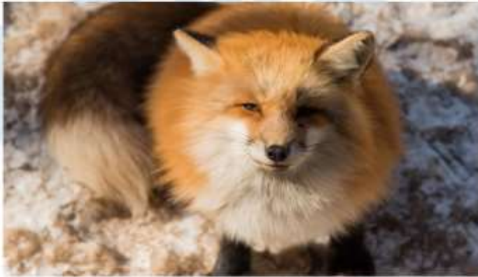
ZAO FOX VILLAGE