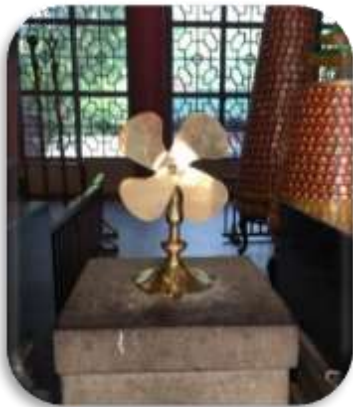
เจ้ามาแทน

☉ การหมุนกังหันนำโชคที่ตั้งอยู่ในวัดเพื่อจะได้หมุนเวียนชีวิตของเราและครอบครัว ให้มีความเจริญก้าวหน้าด้านหน้าที่การงาน โชคลาภ ยศศักดิ์ และถ้าหากคนที่ดวงไม่ดีมีเคราะห์ร้ายก็ถือว่าเป็นการช่วยหมุนปัดเป่าเอาสิ่งร้ายและไม่ดีออกไปให้หมด ในองค์กังหันนำโชคมี 4 ใบพัด คือพร 4 ประการ คือ สุขภาพร่างกายแข็งแรง, เดินทางปลอดภัย, สมความปรารถนา และ เงินทองไหลมาเทมา ในทุกๆวันที่ 2 ของเดือนแรกตามปฏิทินจีนชาวฮ่องกงและนักธุรกิจจะมาวัดนี้เพื่อถวายกังหันลมเพราะเชื่อว่ากังหันจะช่วยพัดพาสิ่งชั่วร้ายและโรคภัยไข้เจ็บออกไปจากตัวและนำพาแต่ความโชคดี