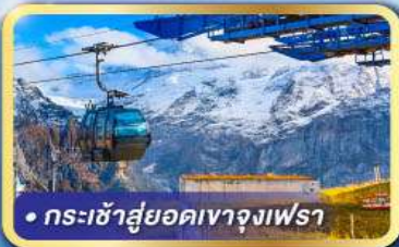
• กระเช้าสู่ยอดเขาจุงเฟรา