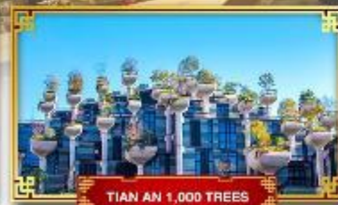
TIEN AN 1,000 TREES